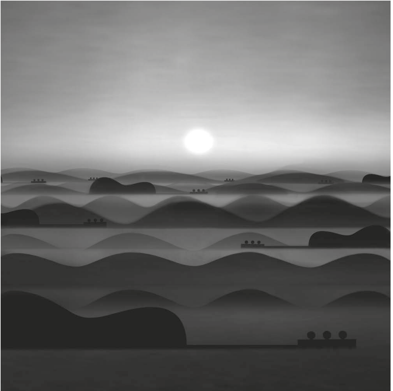
Pilar García Merino Serie "Paisaje de cuerda"