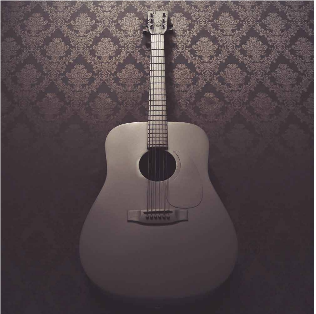
Marisa Vadillo Serie "Réquiem negro"