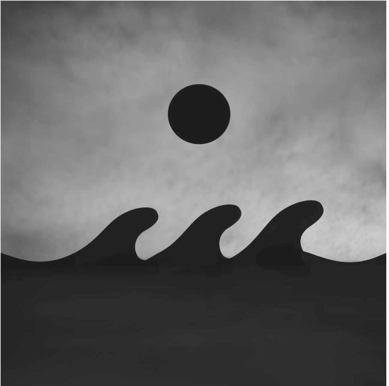
Pilar García Merino Serie "Paisaje de cuerda"