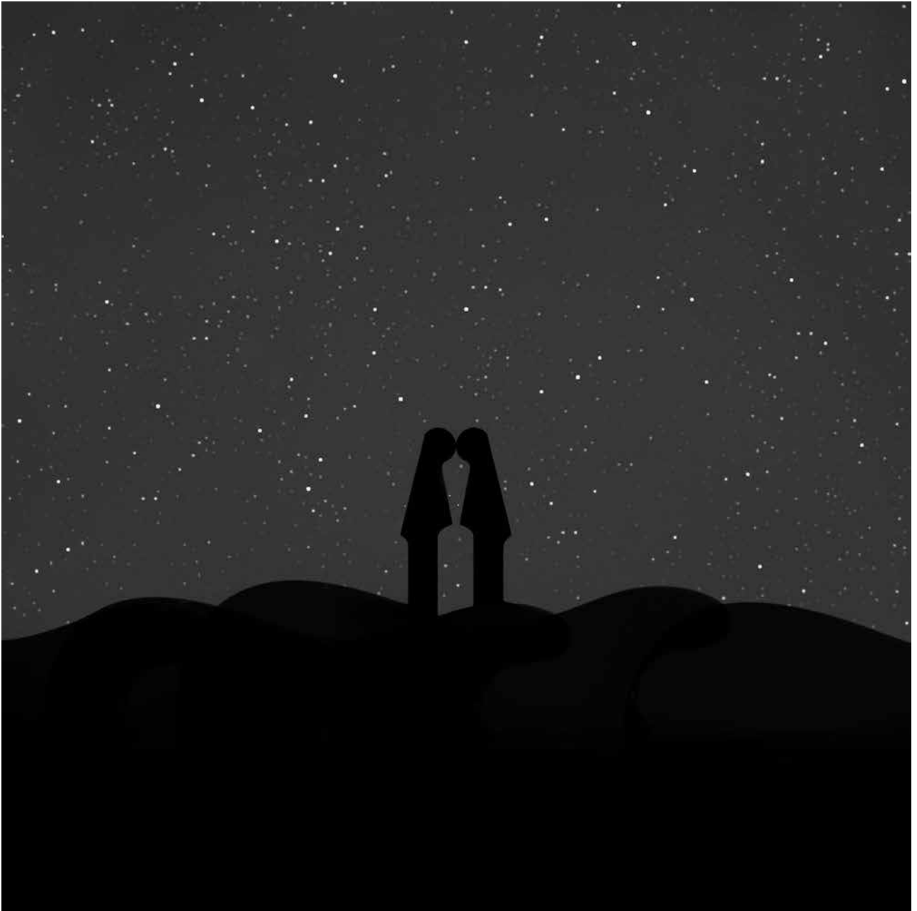
Pilar García Merino Serie "Paisaje de cuerda"