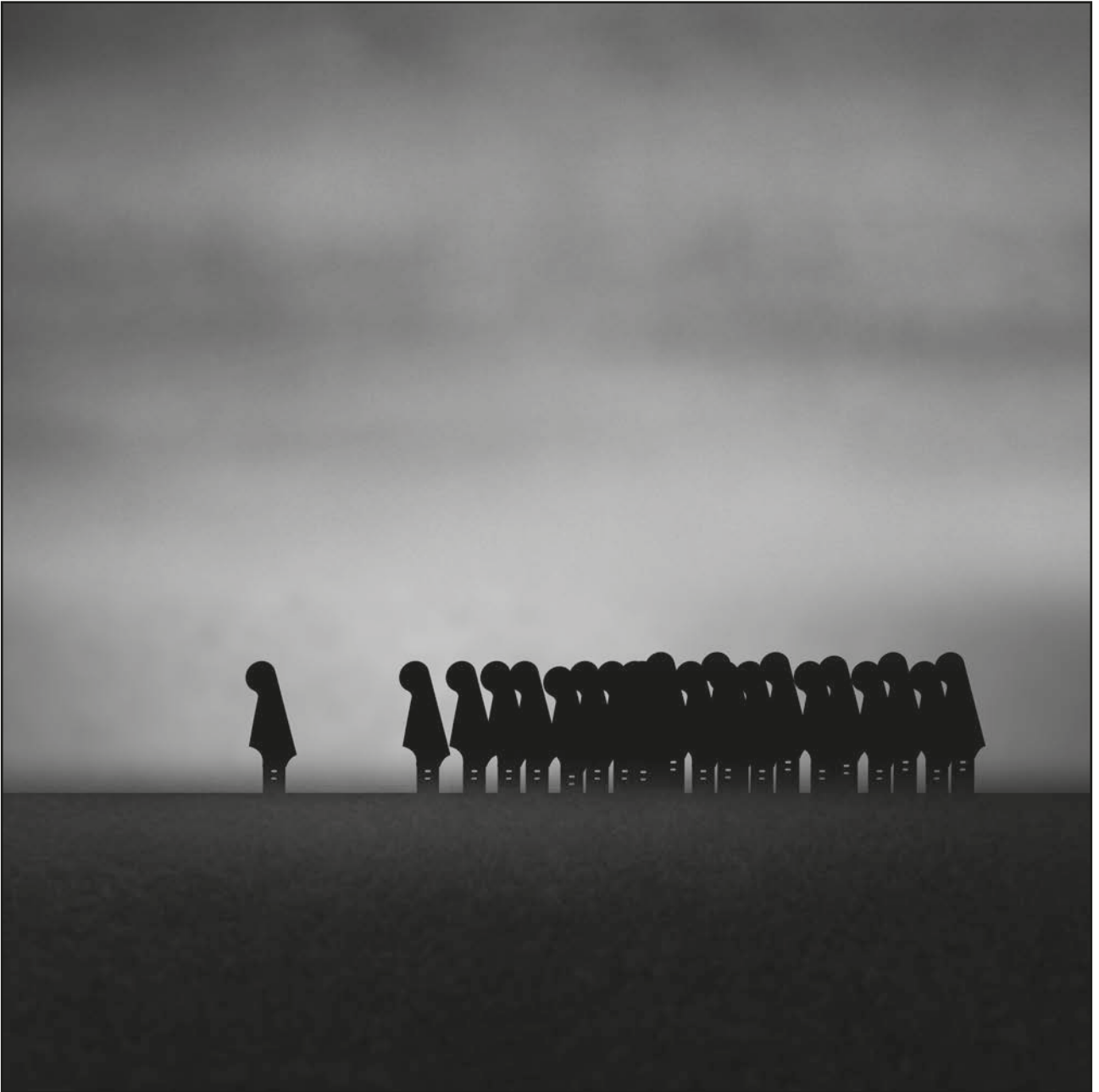
Pilar García Merino Serie "Paisaje de cuerda"