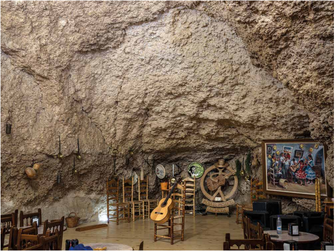
José María Mellado "Gerundina en la cueva de la Peña El Morato" Almería. 2023